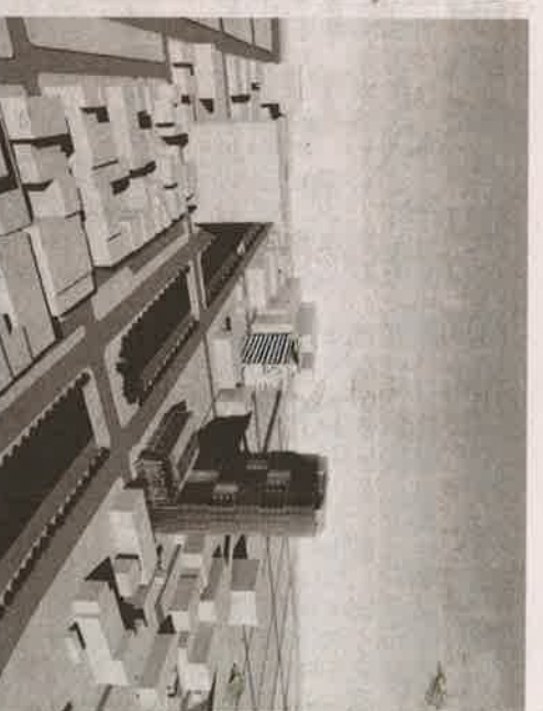
左二：東方大廈選址北側的珍珠街和東側的華人天主教堂暨學校。右邊設計圖則顯示建成後的東方大廈將成為北華埠新高樓。