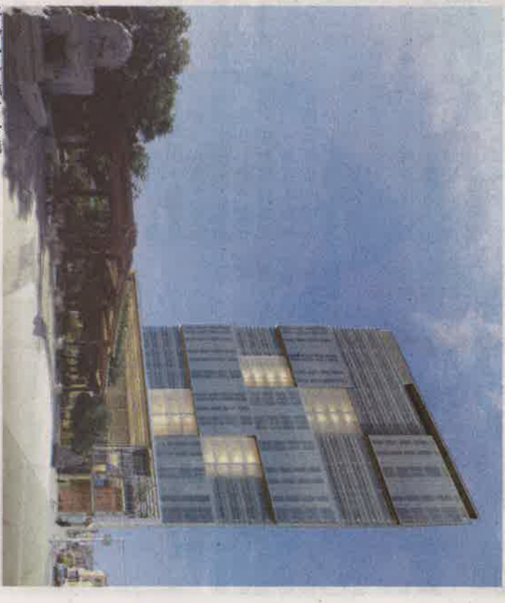
左圖及上圖為從十街和珍珠街觀測的東方大廈選址現狀。右圖為建築設計室 KlingSubbins 提供的東方大廈概念圖。